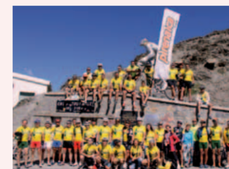
Final de l'édition 2011, à Urzainqui.

Pirenaica 2012 est déjà en marche. Ils fêtent cette année leurs 10 ans et chez Ulzama Imprimerie nous avons décidé de monter à vélo avec eux. Pour cela nous soutenons cette course par notre parrainage, afin de pouvoir apporter un grain de sable au sport. En plus, cette année, coïncidant avec le dixième anniversaire de la course, ils ont préparé un parcours spectaculaire dans les Pyrénées, avec des cimes mythiques, des nouveaux, des grands et surprenants et des finales de Tour. Mais une autre course a aussi été organisée dans les Dolomites, mettant en route une nouvelle aventure, Cycling Dolomiti. Même philosophie, même organisation, mais cette fois-ci en terre italienne. Nous y serons!